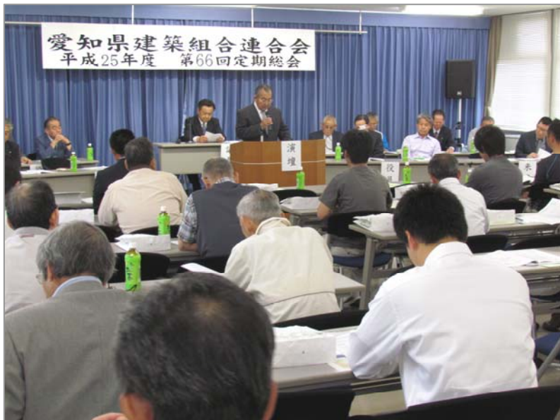
定期総会の様子(国保組合会館)

〒462-0844 名古屋市北区清水五丁目6-9 TEL. 910-0608/FAX. 910-0609